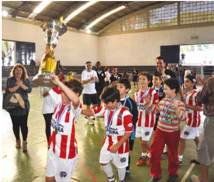
Jogador levanta a taça após a final do Campeonato Bom de Bola, Bom de Escola

► No pré-mirim, a equipe da Escola Municipal “Antonio Daher” (Cohab II) venceu por 3 a 0 o “Cel. José Venâncio” na final e ficou com o título. Na categoria mirim, o Colégio Cecília Meireles goleou na final a Escola Municipal “Antonio Daher” (Cohab II) por 8 a 1.