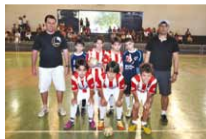
Colégio Cecília: campeã do mirim