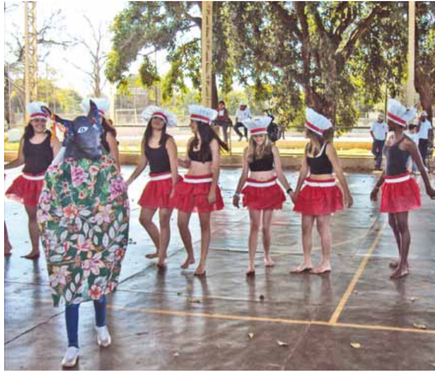
Apresentação abordou as tradições e a cultura dos índios brasileiros

► A Escola Lamounier realizou a Feira do Folclore, evento que contou também com danças e teve sua finalização com um concurso de pipas. Já a Escola Técnica Agropecuária Municipal realizou a Feira de Ciências com os trabalhos confeccionados pelos alunos do curso Técnico em Agroecologia.