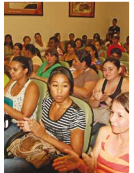
Lançamento da Frente de Trabalho

▶ O Programa Emergencial de Auxílio Desemprego aconteceu no dia 3 de Setembro e beneficiou 70 colinenses em situação de desemprego, que ganharam 9 meses de trabalho.