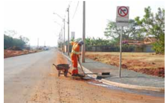
► Prefeitura também constrói calçadas