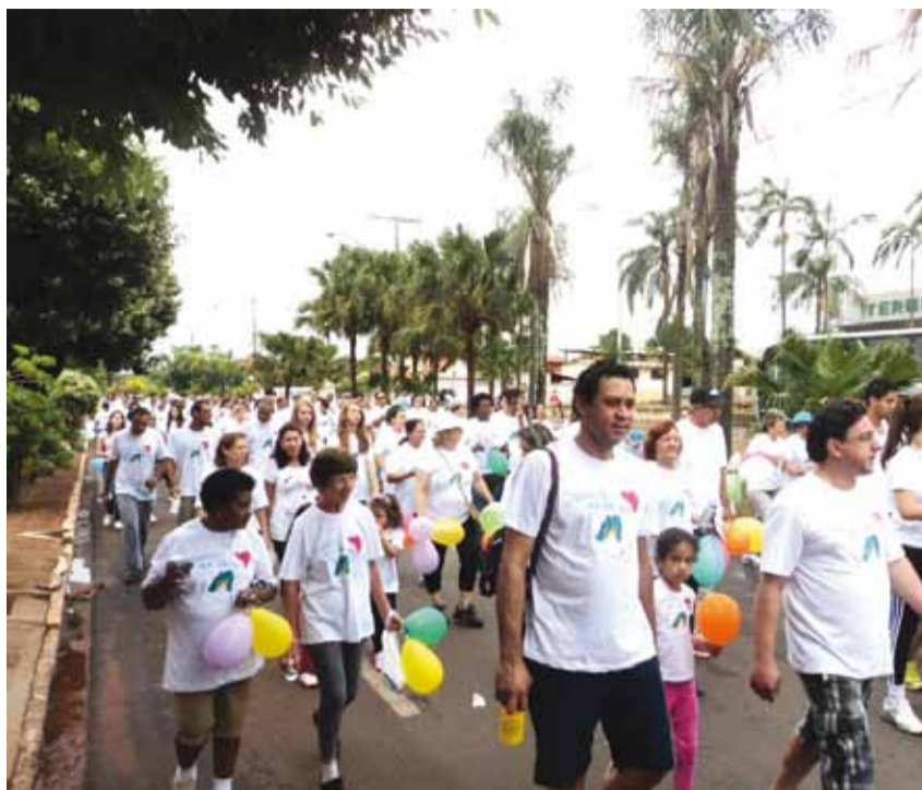
1ª Caminhada Contra o Câncer, realizada simultaneamente em mais 21 cidades da região

► Com total apoio da Prefeitura, a Campanha “Passos que Salvam” — lançada pela Fundação Pio XII de Barretos em prol do Hospital de Câncer Infantil, “Lulinha” — foi sucesso. Mais de 946 kits de camiseta e squeeze foram vendidos em Colina, sendo 100% da renda revertida ao Hospital.