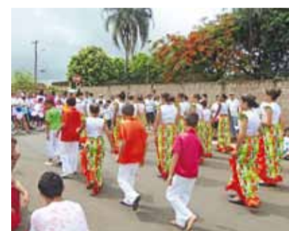
Moradores exaltaram solidariedade

Secretaria participa da ação “Outubro Mês da 3ª Idade”