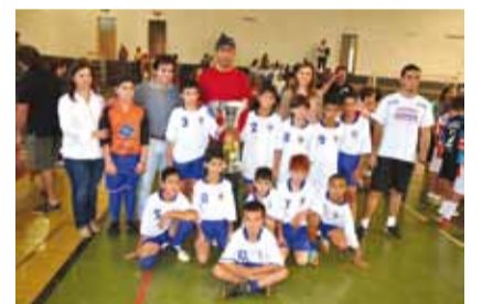
Equipe da Cohab 2