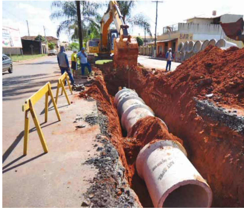
Construção de galerias ao longo do canteiro central da Avenida Luiz Lemos de Toledo

► A Prefeitura de Colina iniciou em fevereiro de 2012 a pavimentação asfáltica e a construção de guias e sarjetas dos loteamentos Jardim Moleiro 1 e 2, Loteamento Polizelli, José Ribeiro e Antonio A. Moleiro e também na Av. Luiz Lemos de Toledo.