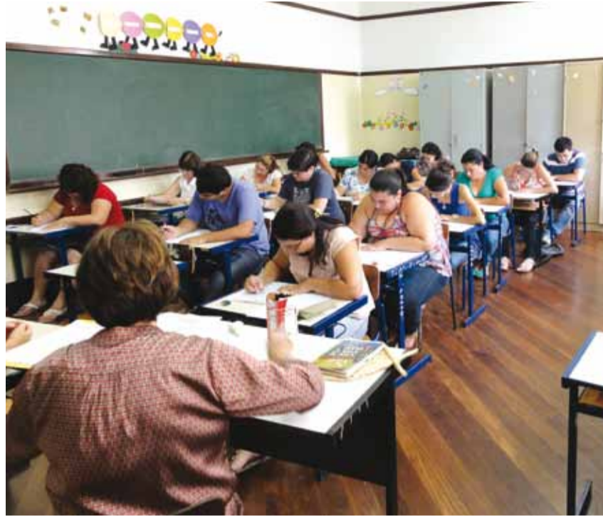
Alunos de curso à distância durante aula presencial

► Os cursos de educação a distância são realizados com aulas presenciais (em escolas de Colina) e também por meio da internet. Dessa forma, muitos colinenses estão conquistando uma profissão sem precisar viajar todos os dias para outras cidades e nem pagar altas mensalidades pelo curso.