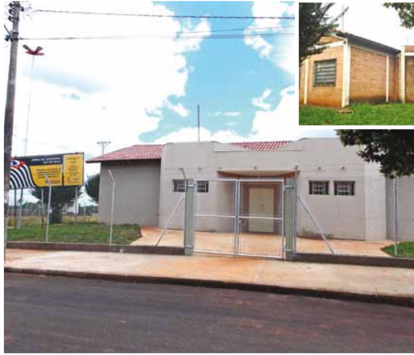
O Centro Comunitário do Jardim Hípico, antes (detalhe), durante e depois da reforma

► A reforma contempla troca de pisos e janelas, melhorias nas redes elétrica e hidráulica e telhado, pintura geral do prédio, além da construção de 1.340 m 2 de alambrado e campo de futebol society. A comunidade ganhou um espaço adequado, seguro, com acessibilidade, para o lazer.