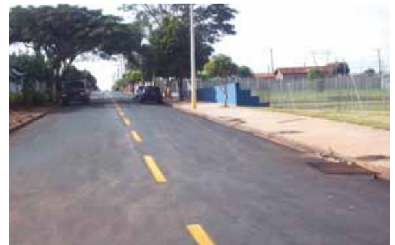
► Sinalização orienta motoristas e pedestres