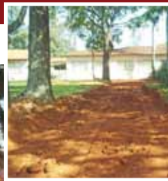
Via de acesso à escola, que foi totalmente asfaltado, facilitando a entrada de veículos e pedestres

► Realizada em etapas, as obras de reforma da EMEF "Lamounier de Andrade" incluíram o asfalto da entrada principal da escola e a construção do estacionamento, com guias, sarjetas e pavimento. Também foram construídos passeios internos de acesso às quadras; reforma do piso, da iluminação e das pinturas demarcatórias das quadras; substituição de alambrados e portões na área verde interna; instalação de bancos nos pátios e remodelação do layout de entrada da escola. Na última etapa, está prevista a troca de toda a cobertura da escola. Nessa etapa também serão reformados os sanitários de uso dos alunos e revisadas as instalações elétricas.