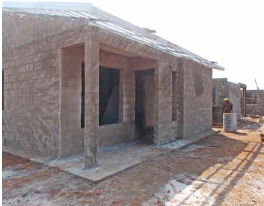
Casas estão sendo construídas em terreno próximo ao Nosso Teto e terão muro divisório entre os lotes e tratamento paisagístico

► Os imóveis serão destinados às famílias de baixa renda, que ganham até três salários mínimos. Casas terão sistema de aquecimento solar; azulejo na cozinha e no banheiro; cobertura na área de serviço; laje; revestimento do piso em todos os cômodos; entre outras melhorias.