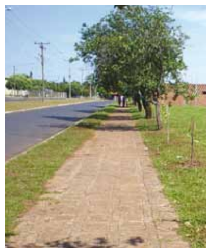
► Replântio de árvores na cidade