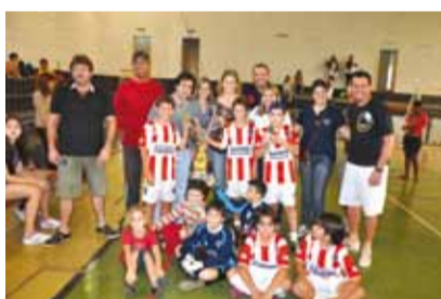
Alunos do Colégio Cecília com a taça