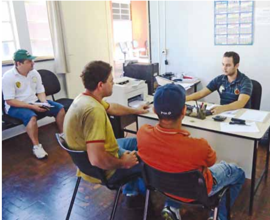
Interessados devem buscar a formalização por meio do Banco do Povo

▶ A formalização beneficia, principalmente, quem trabalha por conta própria e, por isso, não tem acesso aos direitos sociais. O objetivo do programa de Micro Empreendedor Individual (MEI) é tirar da informalidade trabalhadores autônomos, que tenham faturamento de até R$ 60 mil por ano.