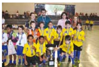
Vice-campeão do mirim: Cohab 2