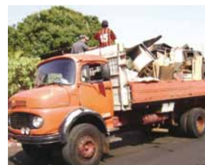
Ação recolheu 9 caminhões de entulhos

Colina é elogiada por prevenção contra o Câncer