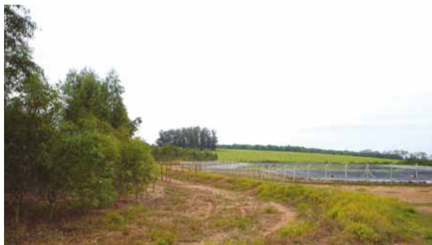
► Reflorestamento da Estação de Tratamento de Esgoto Retirinho