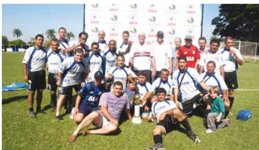
▶ Ranchão derrotou o Unifera na final por 4 a 0 do Campeonato Municipal Veterano 2012 e conquistou o bicampeonato. A equipe ficou com os títulos de Melhor Técnico e os prêmios de Melhor Jogador da Final e Artilheiro.