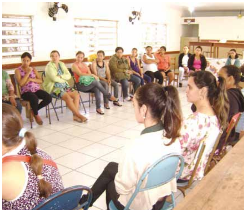
Gestantes formam grupo e participam de vários cursos de orientação

▶ Gestantes participam de vários cursos com orientações de saúde e bem estar durante a gestação, parto e pós-parto. As palestras são realizadas por médicos e profissionais da Secretaria Municipal de Saúde e abordam vários temas como a estimulação da fala e linguagem do bebê.