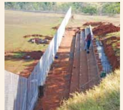
Construção da arquibancada

► A Prefeitura construiu um campo municipal de futebol, vestiários e arquibancadas em área localizada na divisa da Cohab I com o Jardim Primavera. A obra beneficiará também os moradores dos bairros vizinhos, Jardim Andorinha e Multirão.