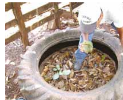
Fiscalização em pneus