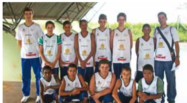
Na classificação geral, Colina conquistou a 3ª colocação na categoria sub-14, masculino e 5ª, no feminino. Na sub-17, obteve o 8º lugar no masculino e 5º no feminino