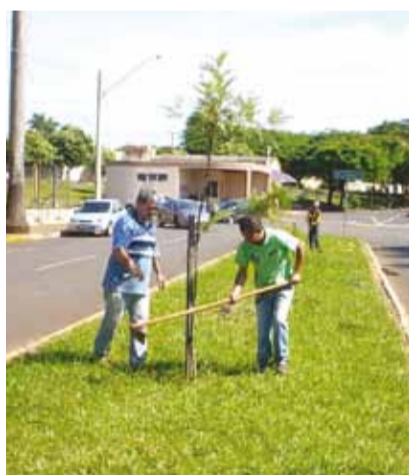
► Homens trabalham no replântio de árvores no centro de Colina