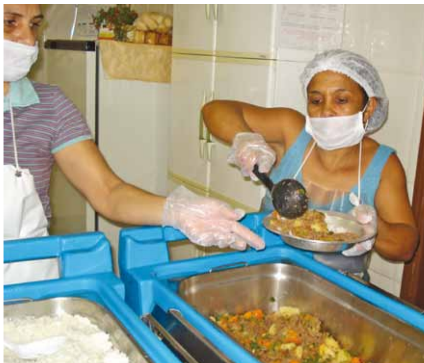
Novas caixas térmicas melhoram o transporte da merenda escolar em Colina

► As caixas térmicas melhoram a segurança, mantêm estável a temperatura, preservam a qualidade dos alimentos e proporcionam maior higiene no transporte da merenda escolar. Agora são 49 unidades para o transporte de 100% da merenda escolar produzida pela Central de Alimentação.