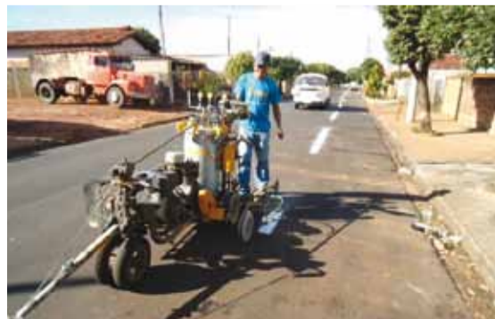
► Máquina ajuda a pintar sinalização