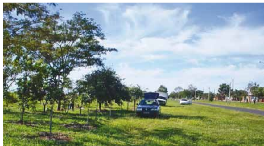
► Replântio de espécies nativas na Rodovia Vicinal Renê Vaz de Almeida