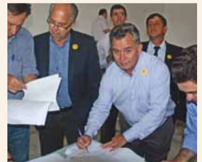
Prefeito assina convênio