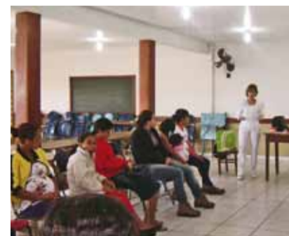
Palestras são ministradas por médicos