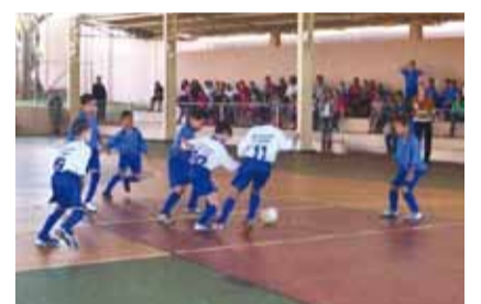
Lance da final do pré-miriam

Colina promove o 6º Regional de Futebol “Divisão de Base”