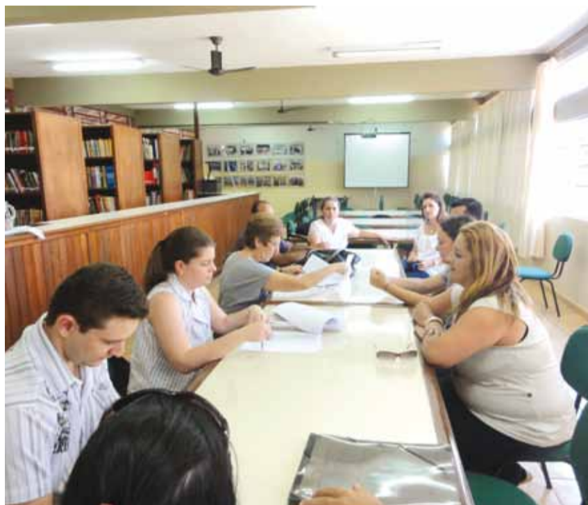
Técnicos do Centro Paula Souza durante avaliação da ETAM

► Avaliação faz parte do trabalho de supervisão de qualidade feita por técnicos do Centro Estadual Paula Souza. Por isso, o município conquistou mais um curso. Trata-se do Técnico em Administração, com 40 vagas, que já foi autorizado pela entidade e será ministrado à noite na Escola Venâncio.