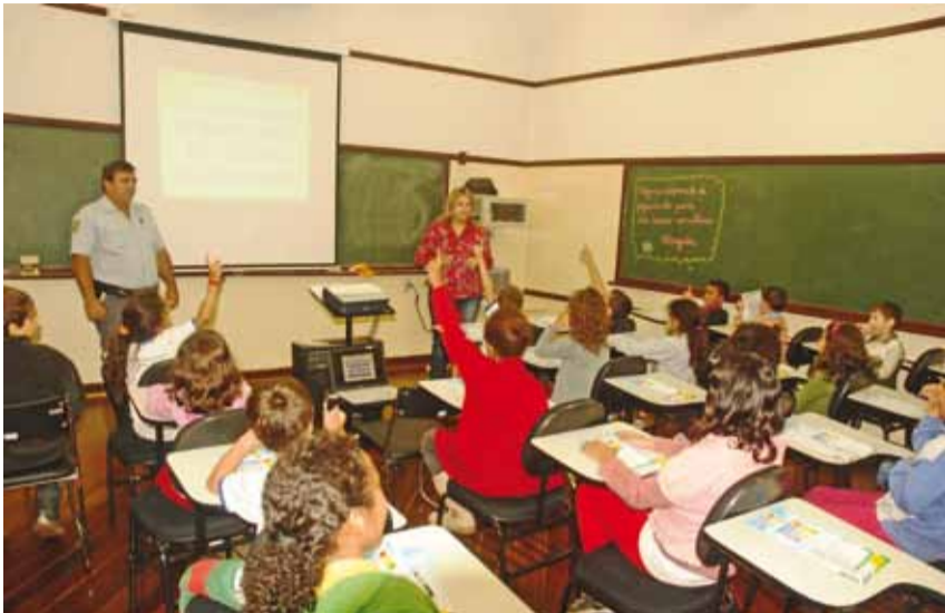
Alunos participam de aula sobre Educação no Trânsito

► A Prefeitura realizou um trabalho social voltado aos moradores do bairro Patrimônio em virtude das melhorias na infraestrutura urbana, desenvolvidas no local. Crianças, ado-