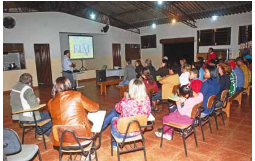
Policial Militar também ministrou palestra para pais de alunos e professores

► A Prefeitura realizou um trabalho social voltado aos moradores do bairro Patrimônio em virtude das melhorias na infraestrutura urbana, desenvolvidas no local. Crianças, ado-