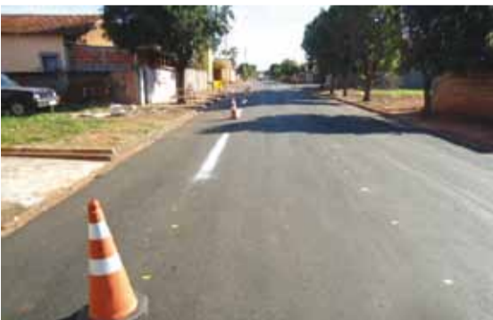
► Sinalização ajudam ordenar o trânsito