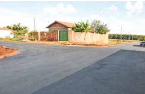
► Ruas foram recapeadas e asfaltadas