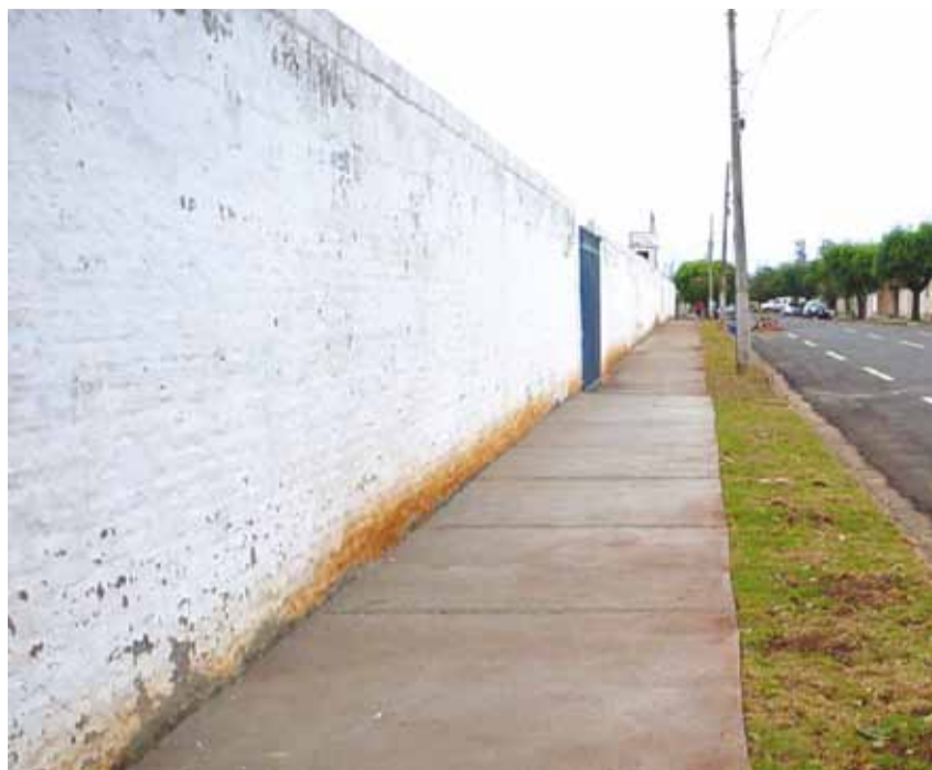
Calçada ecológica na rua Dr. Oscar de Goes Conrado, com passarela para pedestres e grama

► Além de deixar as vias da cidade mais bonitas, a Calçada Ecológica tem outras funções que vão além da estética. Elas ajudam na retenção da água das chuvas e diminuem o calor urbano. A Secretaria Municipal de Meio Ambiente pretende ampliar as áreas com Calçada Ecológica na cidade.