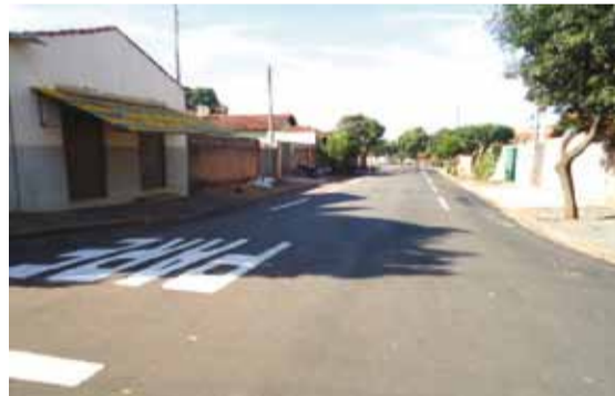
► Sinalização aumenta segurança no trânsito