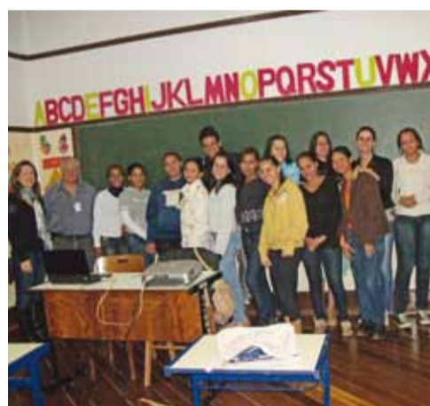
Alunos que participaram dos cursos de Soldador e Auxiliar de Farmácia; objetivo foi incentivar o retorno e a permanência na escola