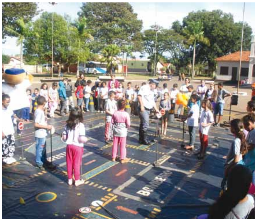
Cidade mirim montada na Praça do Patrimônio; Mais de 100 crianças participaram

► Foram ministradas palestras pela Polícia Militar Rodoviária, em parceria com a Prefeitura e a Concessionária Rodovias TEBE, com apoio da Câmara, com participação de 30 famílias, 50 estudantes e integrantes do projeto Ação Jovem. O grupo ganhou cartilhas sobre o trânsito seguro.