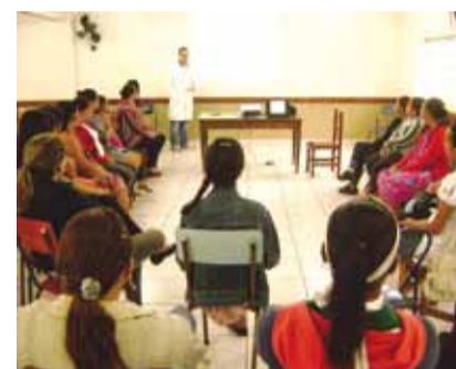
Orientações visam gestação saudável