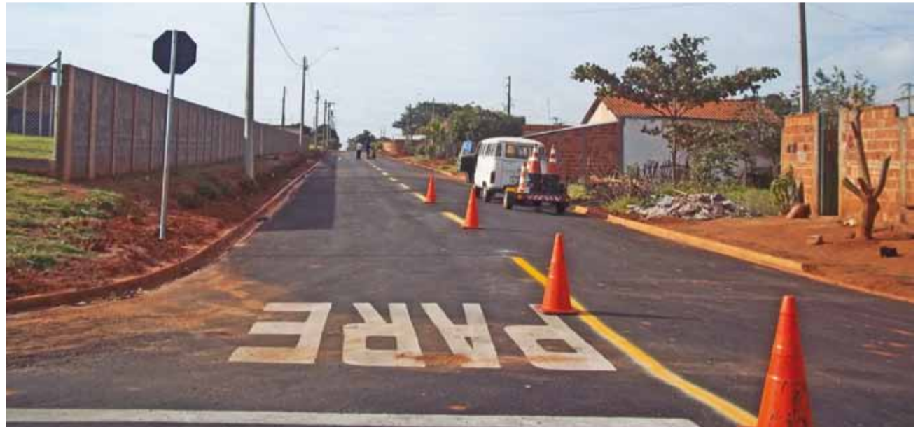
Homens trabalham na implantação da sinalização horizontal e vertical em ruas do bairro Vila Guarnieri

► Após receber a pavimentação e recapeamento, ruas do bairro Vila Guarnieri receberam a sinalização viária, que visam garantir a segurança e a tranquilidade no fluxo de pedestres e veículos.