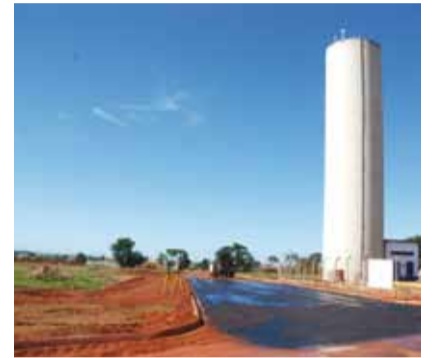
Construção de pavimentação asfáltica