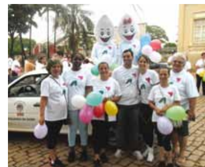
Caminhada envolveu a comunidade