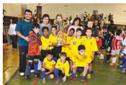
Equipe da escola “Antonio Daher”