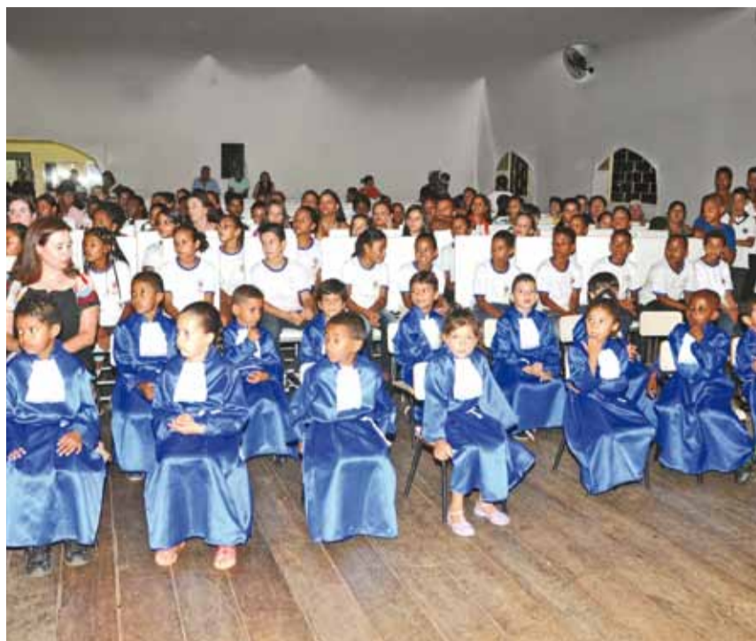
Alunos durante a formatura; ao lado público e apresentações culturais

► As solenidades de formatura certificaram cerca de 620 alunos da Educação Infantil, Ensino Fundamental e Ensino Médio Profissionalizante, da Rede Municipal de Ensino. O ponto alto das formaturas foram as solenidades que contaram também com apresentações de dança, do Coral Estrela Guia e do Projeto Municipal Kung Fu na Escola.