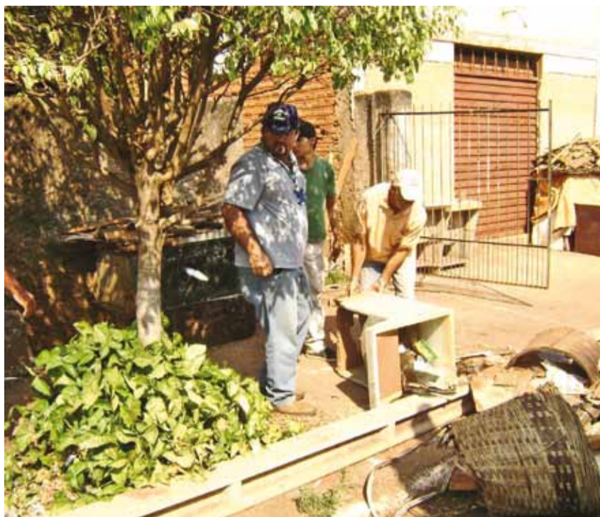
De 2.665 residências visitadas, a equipe encontrou 1.706 materiais inservíveis

► O combate à dengue em Colina é realizado durante todo o ano. A equipe de Vetores realiza diariamente visitas domiciliares, notificando e orientando a população, além do trabalho de busca ativa dos suspeitos e ações educativas, como o “Bota Fora” contra a dengue.