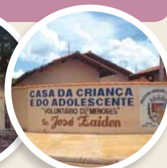
Sede da Casa da Criança