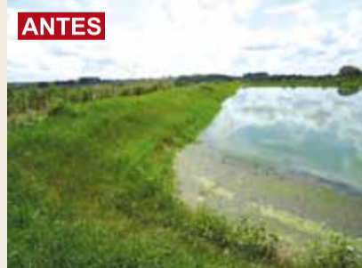
Antes da limpeza