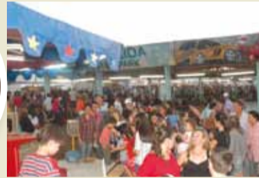
Público no Parque