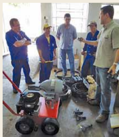
Máquina Desobstruidora de Esgoto