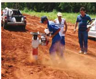
Máquina Compactadora de Solo

► Os equipamentos são: uma Cortadora de Piso de Concreto/Asfalto e um Compactador de Solo, adquiridos em janeiro de 2011. Os equipamentos facilitam o trabalho do SAAEC e garantem mais qualidade no resultado final.