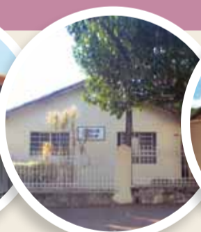
Sede do Conselho Tutelar