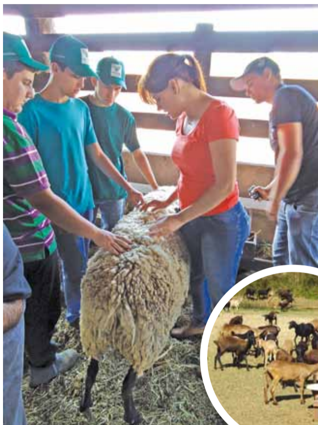
Curso de Ovinocultura