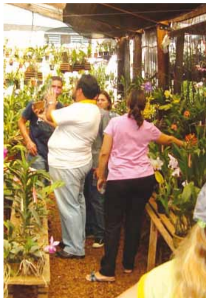
Curso de Orquídea

► Os cursos foram promovidos pelo Posto de Atendimento ao Trabalhador, aplicados e certificados pelas mais respeitadas instituições de ensino profissionalizante do país.