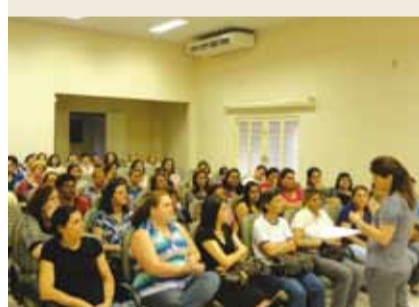
Eleição dos membros do Conselho do Fundeb

► Em construção a cobertura, instalação de iluminação e reforma completa na quadra poliesportiva.