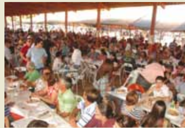
Almoço da Cavalgada