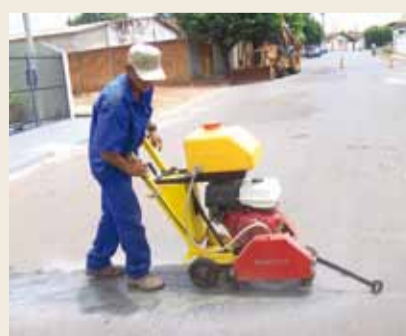
Máquina de cortar asfalto