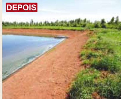
A limpeza pronta