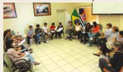
Reunião do Conselho Municipal de Educação

► Compostos por membros da sociedade civil, os conselhos municipais garantem a participação da comunidade na gestão dos recursos da Educação, Cultura e Merenda Escolar, e ajudam a melhorar a aplicação dos recursos.