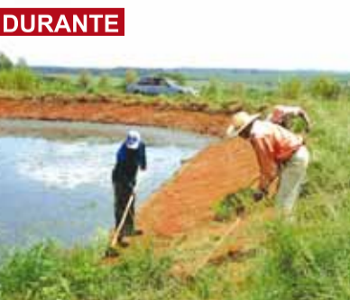
Durante a limpeza

► Limpeza realizada na Estação de Tratamento de Esgoto da Rodovia René Vaz de Almeida, que atende os bairros Vila Guarnieri e Nosso Teto.