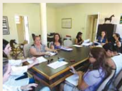
Reunião do Conselho de Alimentação Escolar