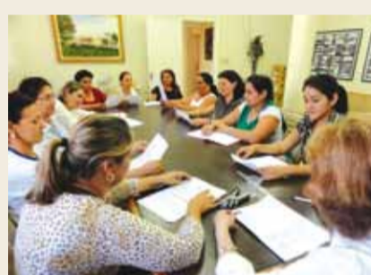
Reunião do Conselho Municipal do Fundeb