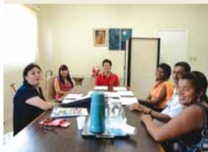
Reunião do Conselho Municipal de Cultura