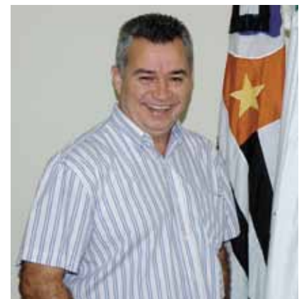
Valdemir A. Morales (Mi) Prefeito Municipal